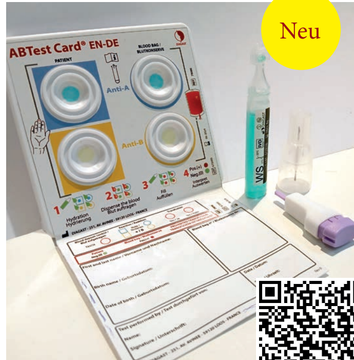
ABTest Card Ref: 79076